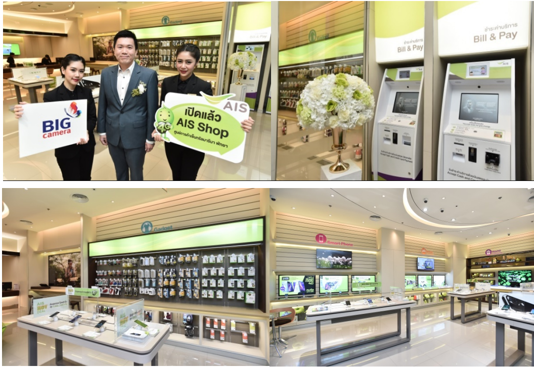
ภาพแสดง สาขา AIS Shop by Partner