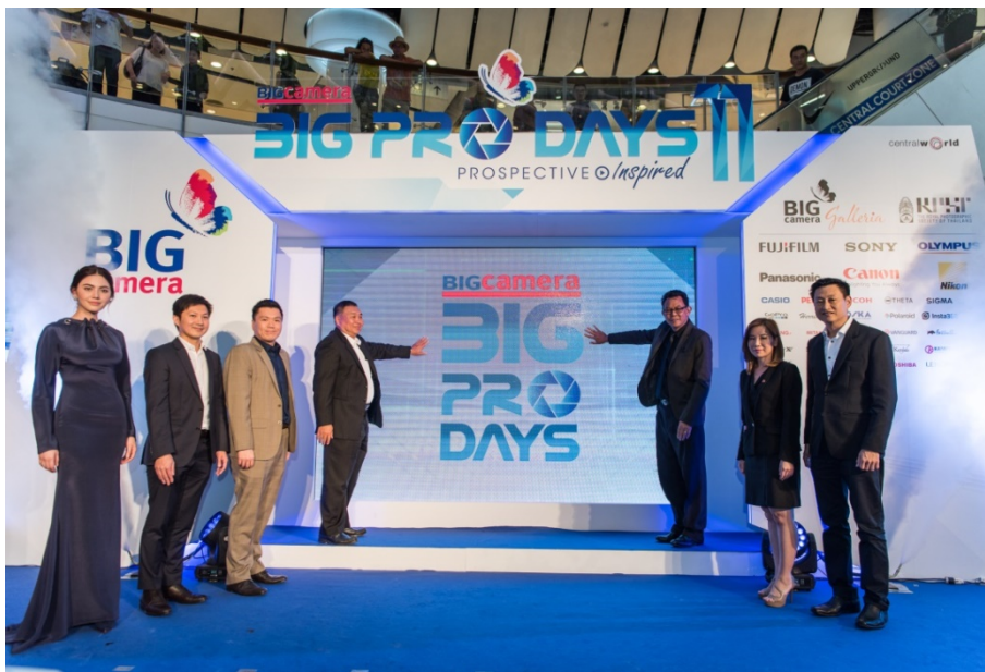
ภาพแสดงงาน BIG Pro Days ครั้งที่ 11