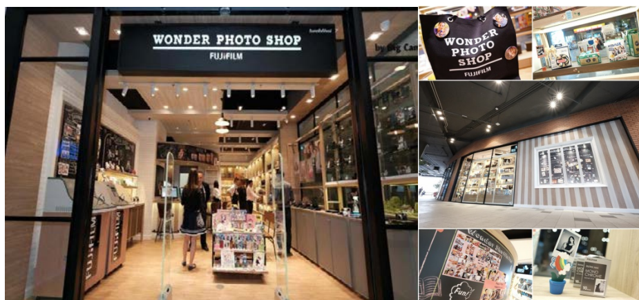
ภาพแสดง สาขา Wonder Photo Shop