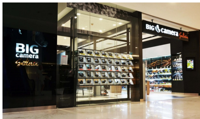
ภาพแสดง สาขา BIG Camera Galleria (Emquartier)