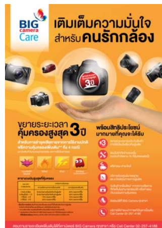
ภาพแสดง บริการขยายระยะเวลาการรับประกันอุปกรณ์ถ่ายภาพ

การให้บริการขยายระยะเวลาการรับประกันอุปกรณ์ถ่ายภาพดำเนินงานภายใต้ชื่อ “BIG Camera Care” ซึ่งผู้บริหารได้เล็งเห็นถึงการบริการหลังการขายอันเป็นสิ่งจำเป็นสำหรับลูกค้าที่ซื้ออุปกรณ์ถ่ายภาพ ภายใต้แนวคิด “ทุกปัญหากลายเป็นเรื่องเล็กได้ และพร้อมเติมเต็มความมั่นใจสำหรับคนรักกล้อง” เป็นบริการที่ บิ๊ก คาเมร่า ให้บริการเป็นปี 6 ซึ่งเป็นความร่วมมือกับ บริษัท สยามคอสโมส เซอร์วิส จำกัด โดยสามารถรองรับลูกค้าที่ซื้อกล้องถ่ายภาพในราคาสูงกว่า 5 พันบาทขึ้นไป การบริการชนิดนี้ให้ประโยชน์แก่ลูกค้าในการขยายระยะเวลาการรับประกันกล้องรูปเพิ่มเติมจากการรับประกันมาตรฐาน (1 ปี) เป็นสูงสุด 3 ปี ภายใต้เงื่อนไขเดียวกันกับผู้ผลิต โดยไม่มีผลผูกพันกับบริษัทผู้ผลิตกล้องแต่อย่างใด นอกจากนี้ยังครอบคลุมถึงการคุ้มครองเพิ่มขึ้นอีก 4 กรณีคือ ไฟไหม้ ฟ้าผ่า ลักทรัพย์ (โดยมีร่องรอย) และไฟฟ้าลัดวงจร