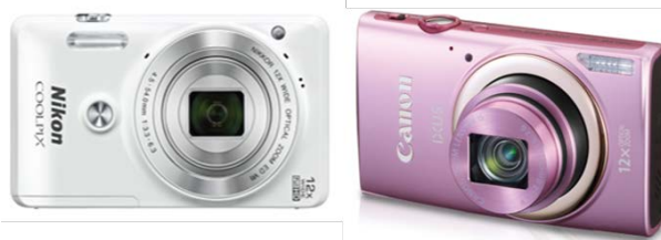
ตัวอย่างกล้องถ่ายภาพประเภทพกพา

เป็นกล้องถ่ายภาพที่มีขนาดเล็ก สะดวกในการพกพาและเป็นกล้องที่เหมาะสมกับนักถ่ายภาพที่เป็นมือใหม่ (Beginner Photographer) ไปจนถึงนักถ่ายภาพในระดับกลาง โดยคุณสมบัติสำหรับกล้องถ่ายภาพประเภทนี้คือ จะเหมาะกับกิจกรรมการถ่ายภาพที่ผู้ถ่ายไม่ต้องการขั้นตอนหรือวิธีการถ่ายภาพที่ซับซ้อนเหมือนกับกล้องถ่ายภาพประเภทอื่น อย่างไรก็ตาม กล้องถ่ายภาพประเภทนี้ค่อนข้างมีข้อจำกัดในเรื่องวัตถุประสงค์ของภาพถ่ายเนื่องจากเป็นกล้องที่ผู้ใช้ไม่สามารถเปลี่ยนเลนส์ได้ ดังนั้นเรื่องประเภทของผลผลิตภาพถ่ายจึงมีข้อจำกัด ปัจจุบันกล้องประเภทพกพายังคงได้รับความนิยมจากกลุ่มผู้บริโภคบางกลุ่มอยู่ เนื่องจากเป็นกลุ่มผลิตภัณฑ์ที่ราคาไม่สูงมากนัก ใช้งานง่าย พกพาสะดวก จึงยังคงเป็นที่ต้องการของตลาดในปัจจุบัน